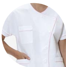
Infirmière puéricultrice Liseré rose

A votre arrivée dans le service, un professionnel soignant vous conduira dans votre chambre. Vous reconnaîtrez les différentes catégories du personnel à leur tenue :