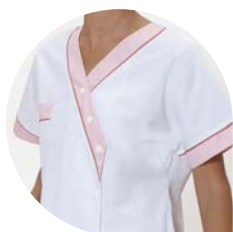
Auxiliaire de puériculture