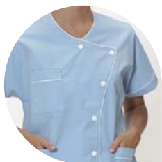
Agent de service hospitalier