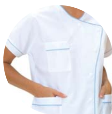
Infirmièr(e) Liseré bleu